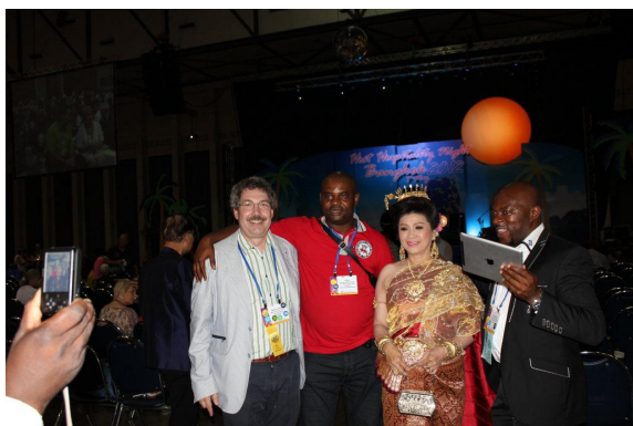
Des rencontres enrichissantes

Autres photos de la convention sur le site