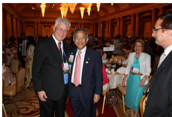
les têtes pensantes du Rotary