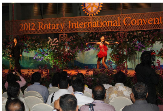
la convention à Bangkok