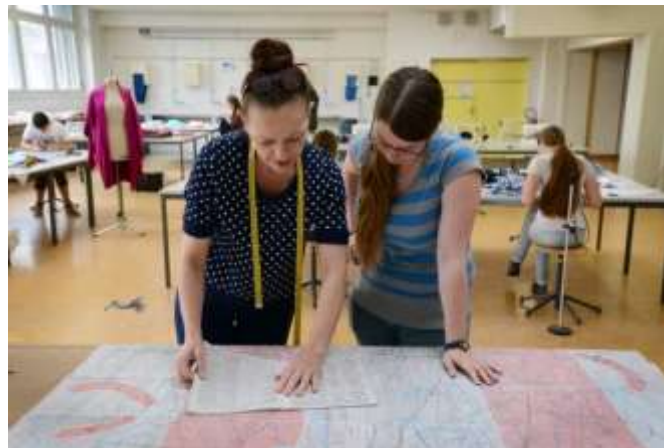
© Maxi Beaux Arts Martine Wolhauser