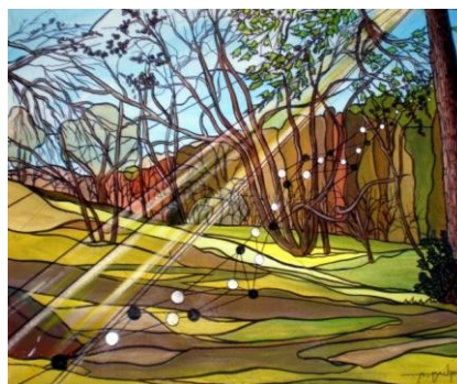
" REPOS A ST REMY » Alain Faure 2013

... Extraits de «Février» Louis-Honoré FRÉCHETTE (1839-1908)