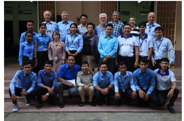
20 e voyage d'information au Cambodge par le conseil de fondation. Visite des physiothérapeutes (en formation)