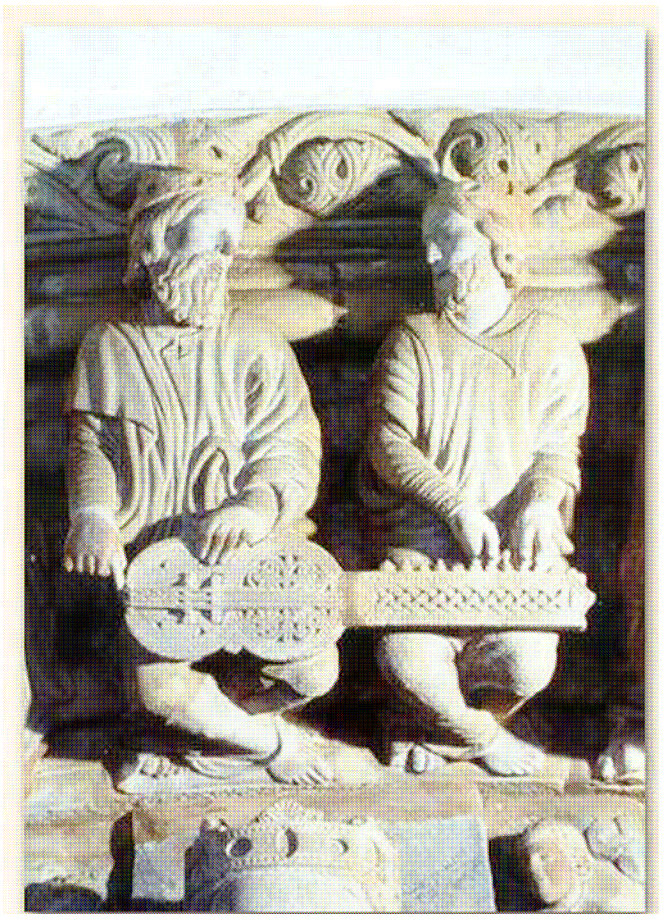
Sculpture du Porche de la Gloire de la Cathédrale Paradis de St Jacques de Compostelle (12 ème siècle).

Le principe de l'instrument est en effet celui d'une vièle à trois cordes avec l'archet remplacé par une roue qui frotte sur ces cordes, pour obtenir un son et des notes continues. Quant à la mécanique de l'organistrum, elle est constituée de tirettes, appelées sautereaux, qui modifient la longueur vibrante des cordes.