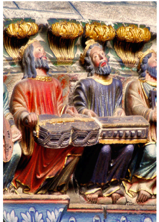
Sculpture polychrome du Porche du de la Cathédrale d'Orens (12 ème siècle).