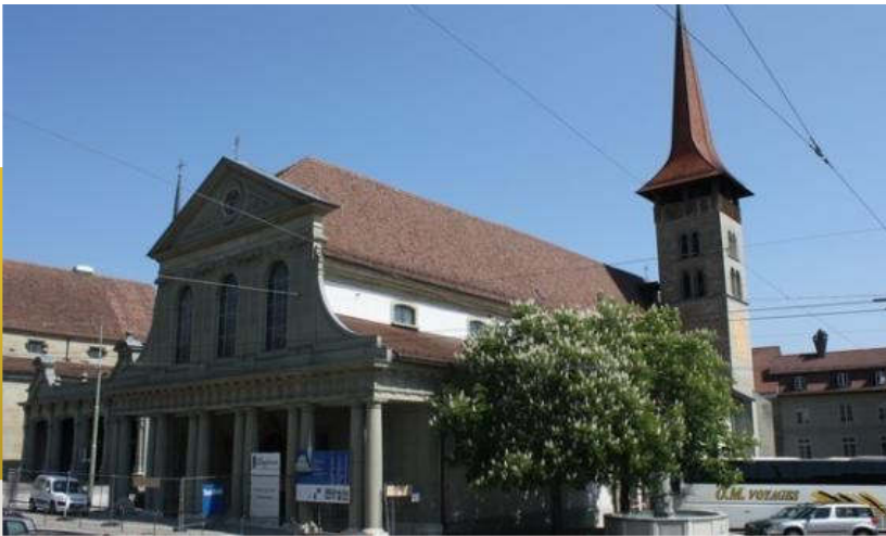
Eglise Notre-Dame à Fribourg / Suisse