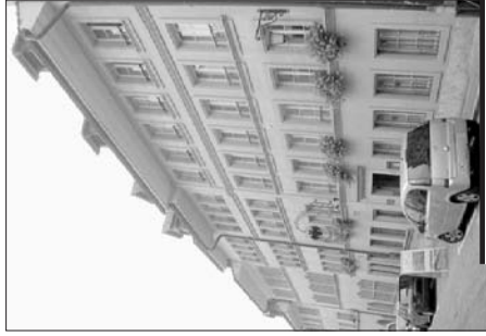
Entrée du bâtiment du SAB, rue des Alpes 10.

Le Conseil communal approuve les budgets et les comptes, autres temps, autres lieux, cette institution représentait jadis une Bourgeoisie limitée à ses seuls membres. Riche en actions... auprès de la population, elle correspond de nos jours à une Bourgeoisie de service – ouverte sur la cité tout entière et régie par la Loi sur les communes – dont les revenus sont affectés à des fins d'utilité générale. La Bourgeoisie a participé au financement de plusieurs projets communaux qui vont, pour les plus récents,