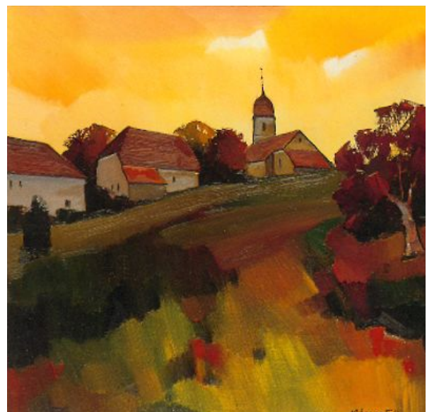
Soir d'automne de tableau de Michel Lescoffit

Le plafond raisonnable d'un club dépend de la capacité de chaque membre d'entretenir avec chacun des liens de camaraderie. A l'inverse, ce critère de convivialité ne donne aucune valeur plancher. Sur le plan amical, les mini-clubs sont des champions. Leur petite taille les rend très vivants et chaleureux. Tous les membres se connaissent bien et se mêlent les uns aux autres. L'attraction qui émane de rapports humains étroits favorise l'assiduité. ... à suivre sous Plus d'info Plus d'info sous http://www.rotary1990.ch/ Photo ci-dessus : Isabelle Tabin-Darbellay : aquarelle « Danse des tourneols ».