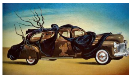
« voiture habillée » Salvador Dali

...à suivre sous http://www.rotary1990.ch/ ci-dessus : Mosaïque de pavement, Antioche IV e siècle après J.-C., Musée du Louvre