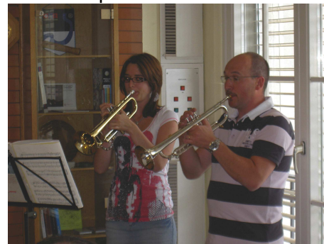
et qui nous démontre ses talents

Pour les lunchs au Domino, merci de vous inscrire auprès d'Yvan Berset